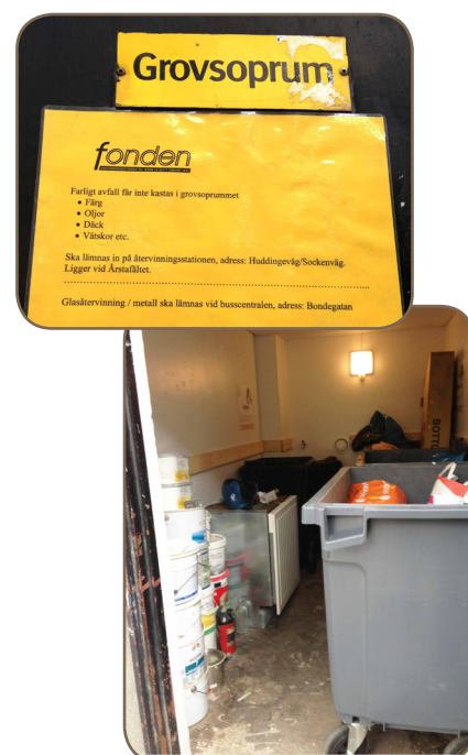
Grovsoprum på Södermalm