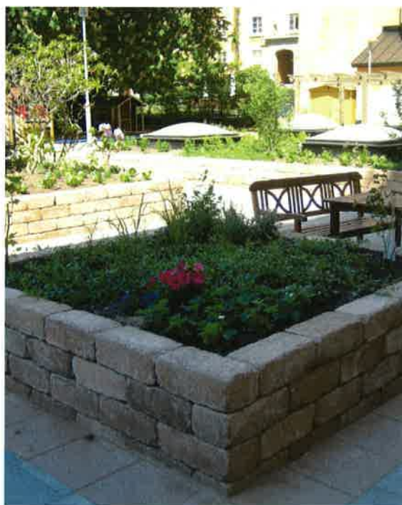
Innergården i kvarteret Lampan på Södermalm har fått en ansiktslyftning och gårdsbjälklaget har renoverats under 2006.