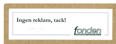
Etiketten har måtten 10x3 cm

Om Du vill vara med och spara på förbrukningen av papper och värna om vår skog, hämta en etikett hos husvärden och sätt på Din brevlåda.